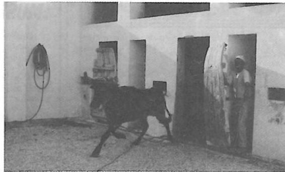
Las vacas siguen siendo el espectáculo más numeroso de los programados. En la instantánea la salida de una de ellas del toril.

Un espectáculo para minorías es la ducha posterior a la cogida de los "toreros". Aparte del revolcón, un remojón de María Santísima. A veces con problemas: como el día que ducharon a una chica que cayó y que con la buena intención de los encargados fue lavada para su posterior curación por los miembros de la Cruz Roja. Lástima que algún "familiar" no lo entendió así por las buenas, y lo comprendió por las malas.