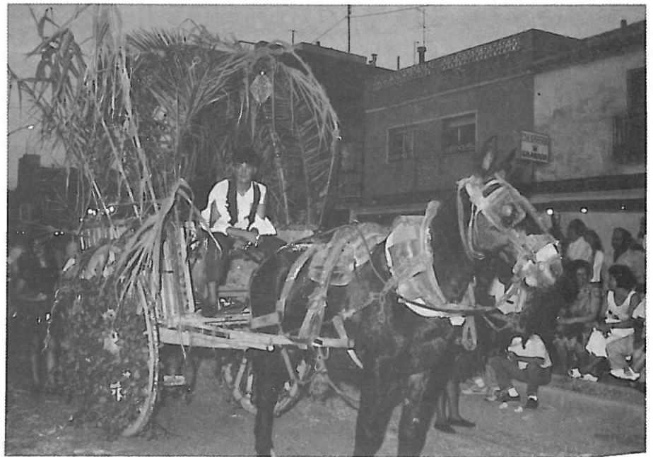
El desfile de carrozas se lució este año más que en anteriores. Quizá la "obligación" impuesta por la Comisión a las Barracas de participar fue el detonante. Si todas las obligaciones dan este resultado, benditas obligaciones.