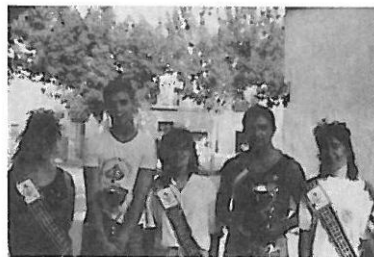
Los campeones del 1.º Trofeo de Fútbolín junto a la Reina y Damas.

Durante los días 1 y 4 de agosto se celebró en la Plaza Colón el primer torneo de fútbolín de Feria y Fiestas, organizado por la Comisión de Fiestas.